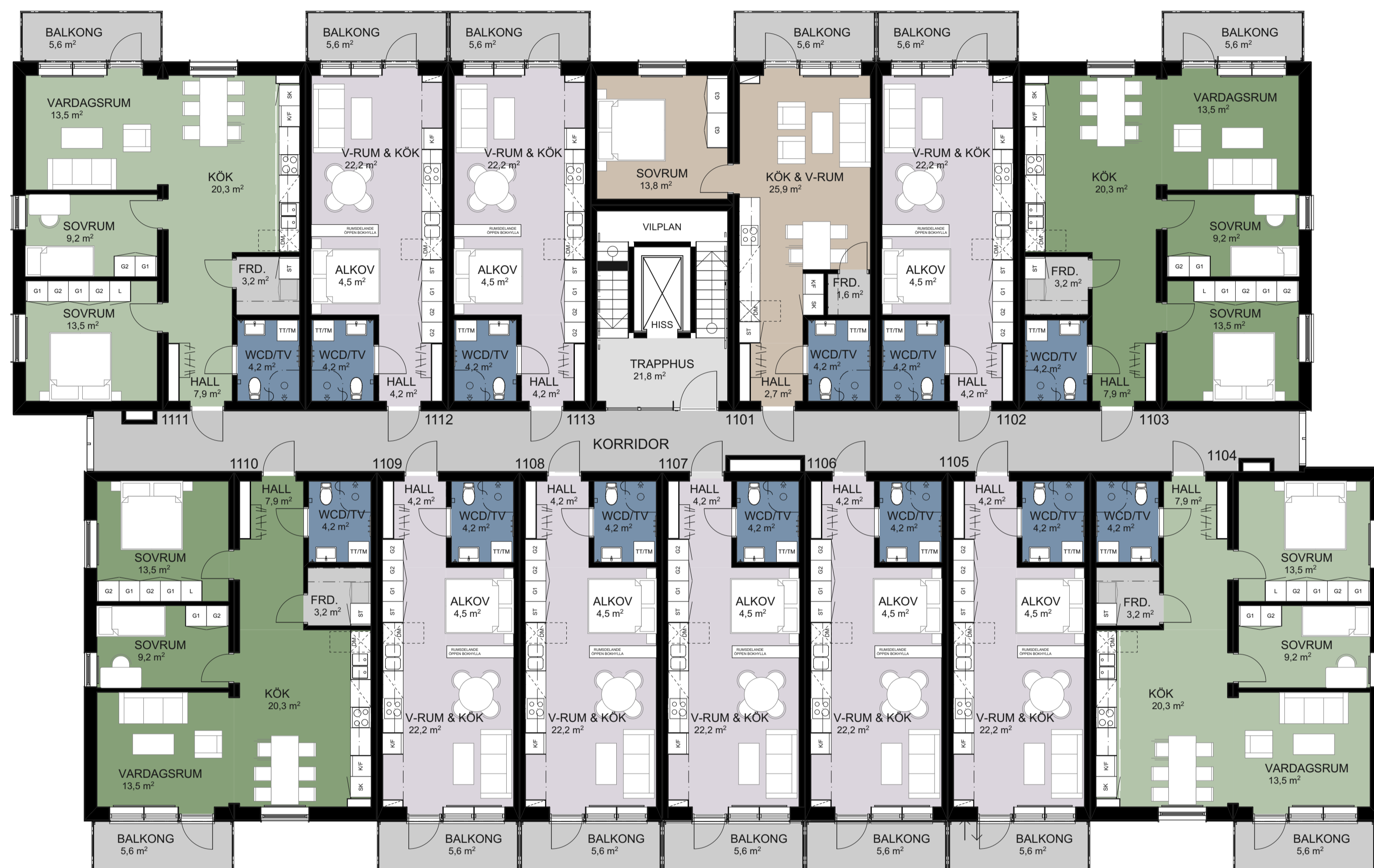
HUS B1: PLAN 2