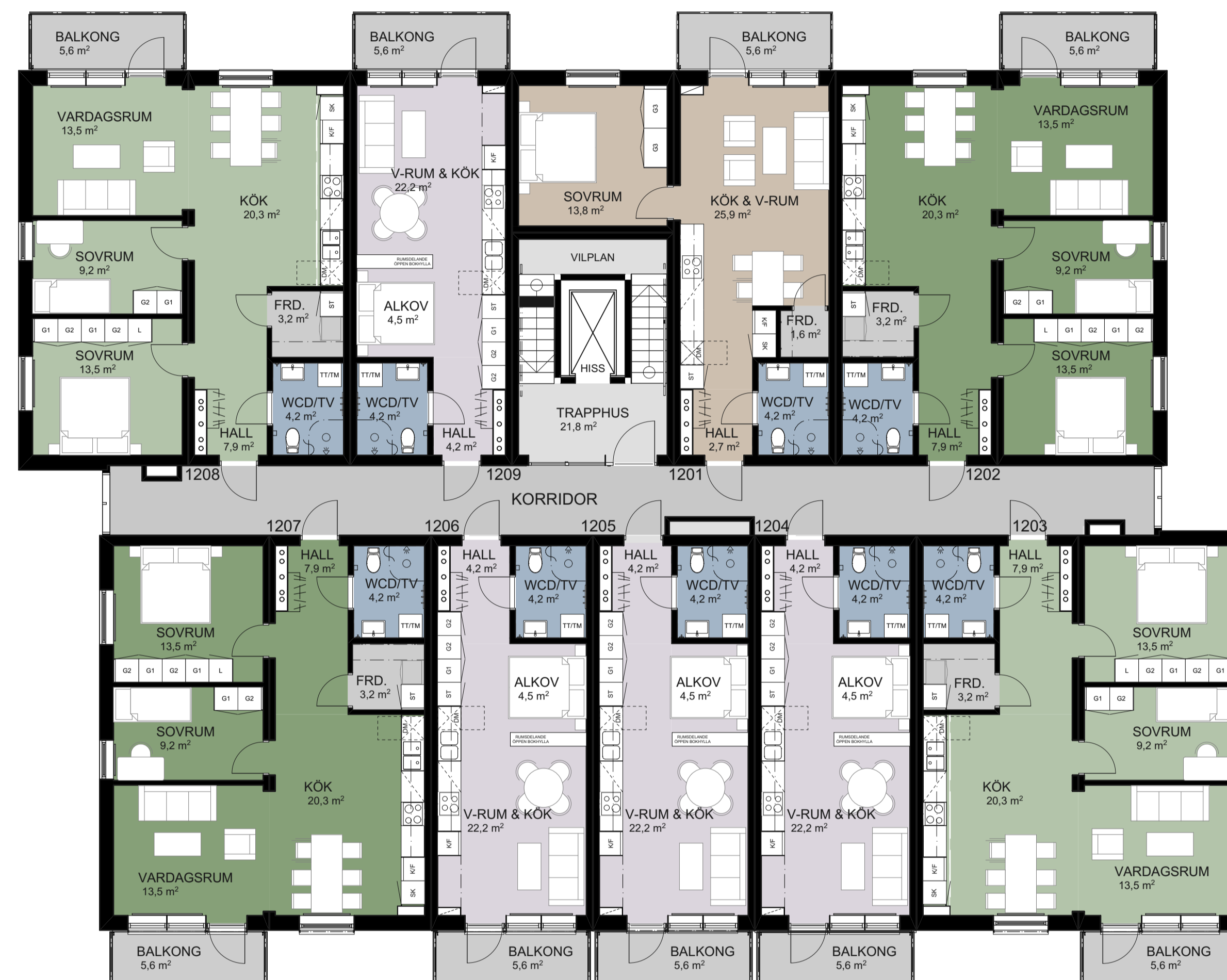
HUS A1: PLAN 3