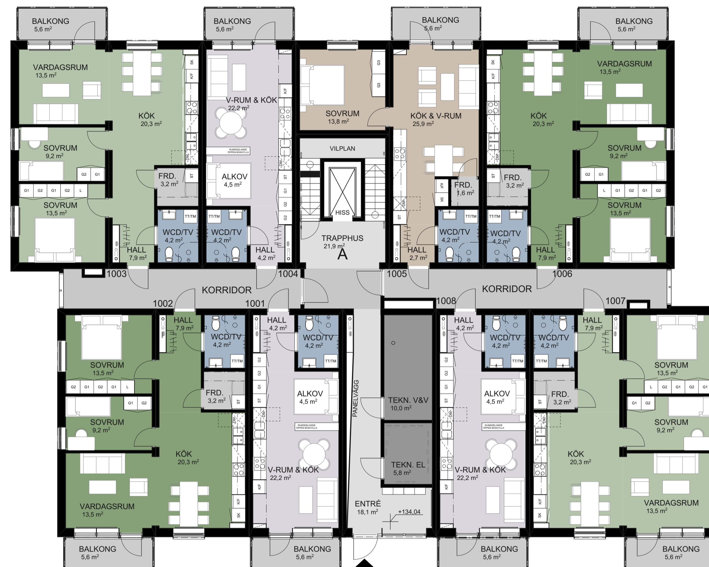
HUS A1: PLAN 1

TOTALT ANTAL LÄGENHETER 35 ST TOTAL BOA 1938,1 KVM